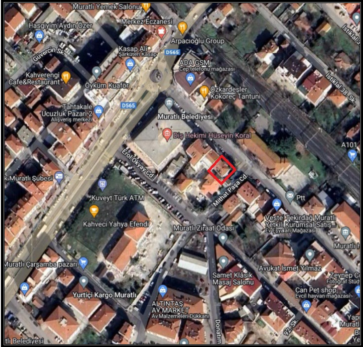
Harita 1: Planlama Alanına Ait Uydu Görüntüsü

Planlama alanı Tekirdağ İli, Muratlı İlçesi, Muradiye Mahallesi sınırları içerisinde bulunan 276 ada 145 parsel numaralı taşınmazı kapsamaktadır. Planlama Alanı 100.Yıl Caddesine cephelidir. İlçe içerisinde merkezi konumda olduğu için Muratlı Belediye Binası ile aynı ada içerisinde yer almaktadır. Ayrıca PTT, İş Bankası, Muratlı İlçesi Kaymakamlık Binası, Akbank, Erol Okyay Caddesi, Tren Garı, Yavuz Sultan Selim Anaokulu, Mithat Paşa Ortaokulu planlama alanına yakın konumda yer almaktadır.