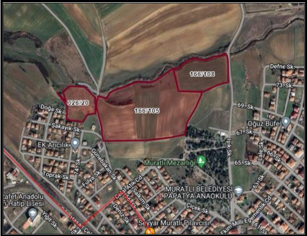
Harita 1: Planlama Alanına Ait Uydu Görüntüsü

Planlama alanı Tekirdağ İli, Muratlı İlçesi, Kurtpınar Mahallesi sınırları içerisinde bulunan 166 ada 105-108 parseller ile 326 ada 20 parsel numaralı taşınmazları ve yakın çevresini kapsamaktadır. Planlama Alanı Ergene Nehri ve Çorlu çayına bağlantısı bulunan Kuru Dere'ye yakın konumdadır. İlçe Merkezine olan uzaklığı kuş uçuşu yaklaşık olarak 1 km'dir. Planlama alanına yakın konumda Muratlı İlçe Mezarlığı bulunmaktadır. Planlama alanı daha önceden imar uygulaması görmemiş, ancak çevrede bulunan parseller uygulamasını görmüş olup, yapılaşmalar bulunmaktadır. Planlama alanı kuzeyinde plan onama sınırı bulunmakta olup, sınırdan ilerisi Tarım Arazi olarak gözükmektedir. Ayrıca planlama alanına yakın konumda Muratlı OSB alanı bulunmaktadır.